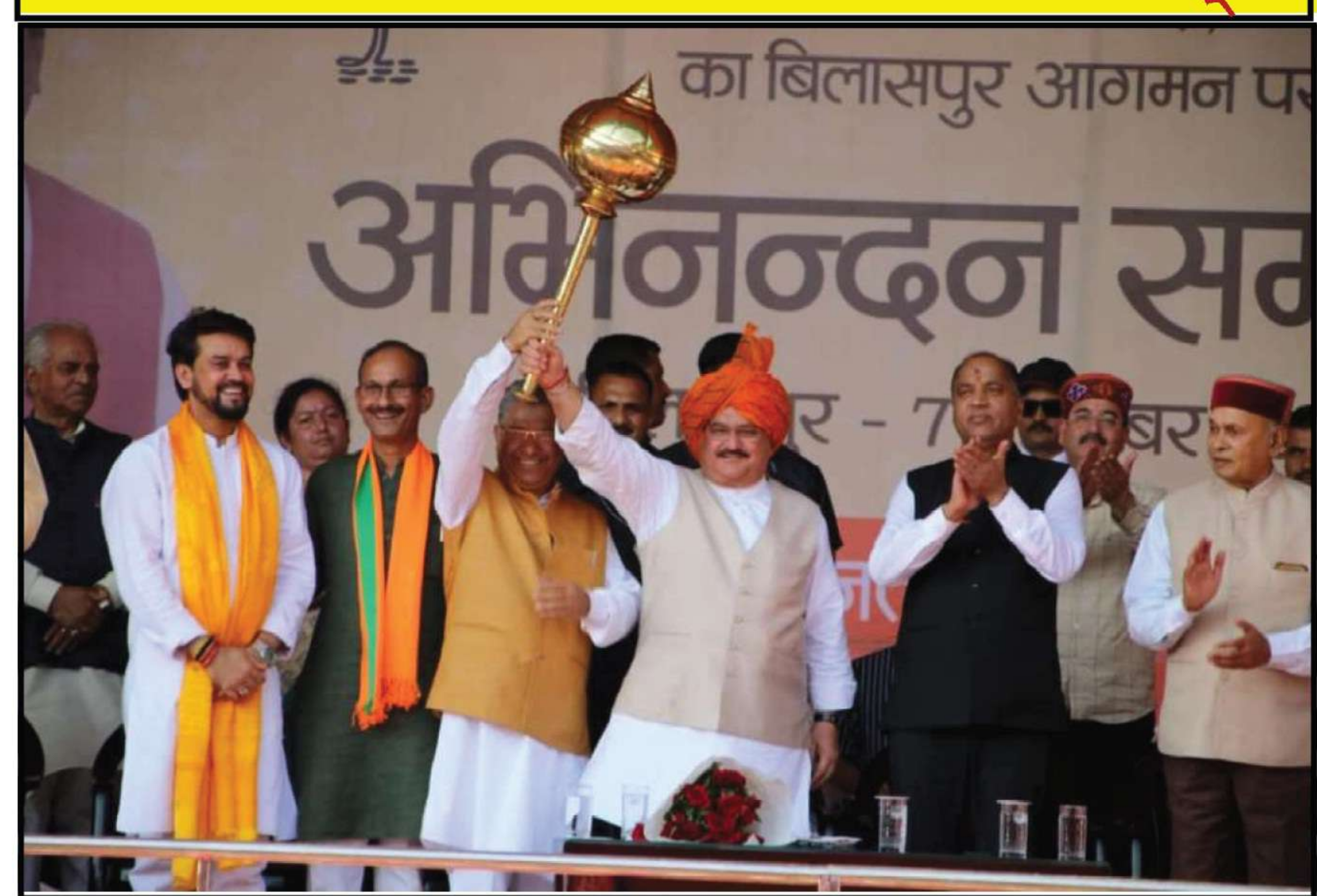
'अभिनन्दन समारोह' के तहत बिलासपुर के ऐतिहासिक लुहणू मैदान में मंच पर भाजपा के राष्ट्रीय कार्यकारी अध्यक्ष जगत प्रकाश नड्डा का स्वागत करते मुख्यमंत्री जयराम ठाकुर, पूर्व मुख्यमंत्री प्रो. प्रेम कुमार धूमल, एवं अन्य

बिलासपुर (प्र.वि.) मुख्यमंत्री जय राम ठाकुर ने भाजपा के राष्ट्रीय कार्यकारी अध्यक्ष जगत प्रकाश नड्डा के स्वागत के लिए बिलासपुर के ऐतिहासिक लुहणू मैदान में आयोजित 'अभिनंदन समारोह' को सम्बोधित करते हुए कहा कि एक छोटे राज्य के लिए यह सम्मान की बात है कि हिमाचल प्रदेश के नेता जगत प्रकाश नड्डा को भाजपा के राष्ट्रीय अध्यक्ष के रूप में भाजपा का नेतृत्व करने की इतनी बड़ी जिम्मेदारी सौंपी गई है। उन्होंने कहा कि ऐसा अवसर जीवन में एक बार आता है जब किसी नेता को दुनिया की सबसे बड़ी राजनीतिक पार्टी का नेतृत्व करने का मौका मिलता है।