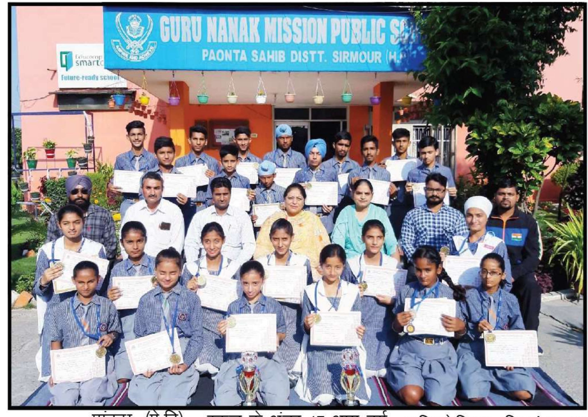
पाँवटा (प्रे.वि.) गुरु नानक मिशन पब्लिक स्कूल के अंडर 17 आयु वर्ग के अंतर्गत छात्रों की खो-खो प्रतियोगिता दिनांक 30 सितंबर 2019 से 2 अक्टूबर